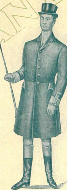
ABRIGO TONNEAU TROMPETERO