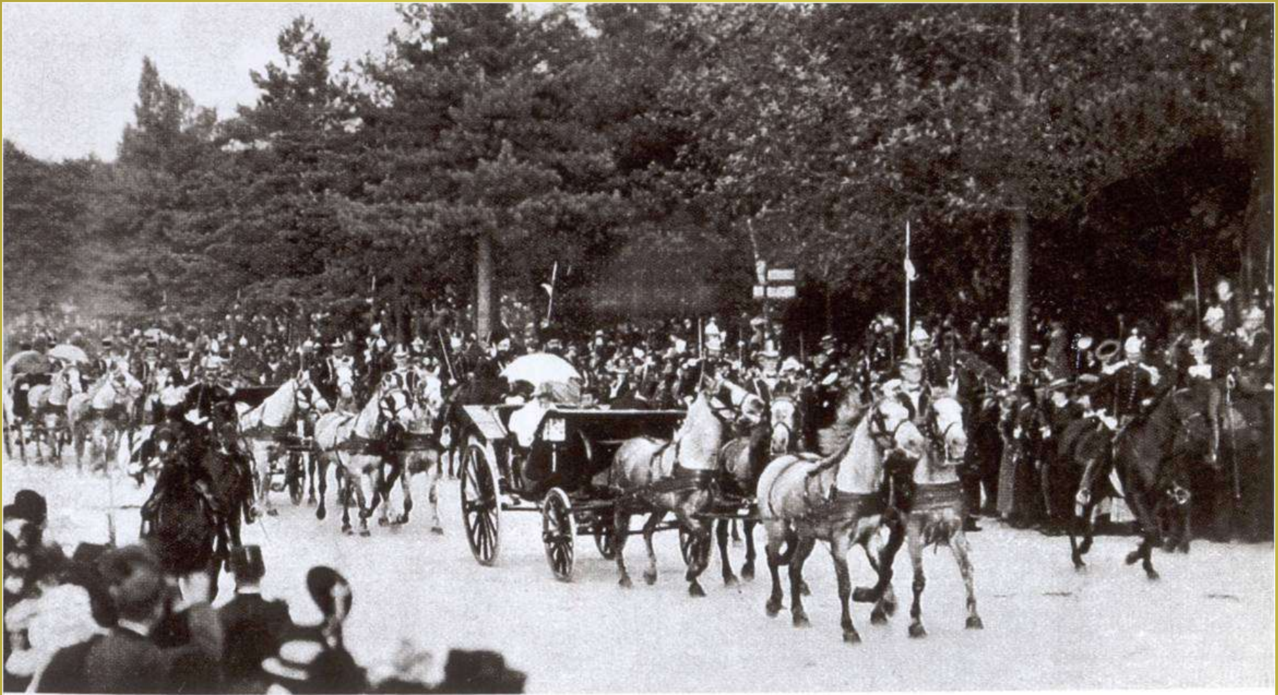
Der russische Zar Alexander I.