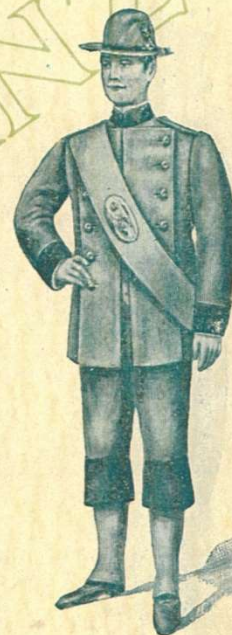
60 GUARDA CON CALZONA