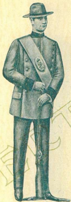
58 GUARDA DE MONTE